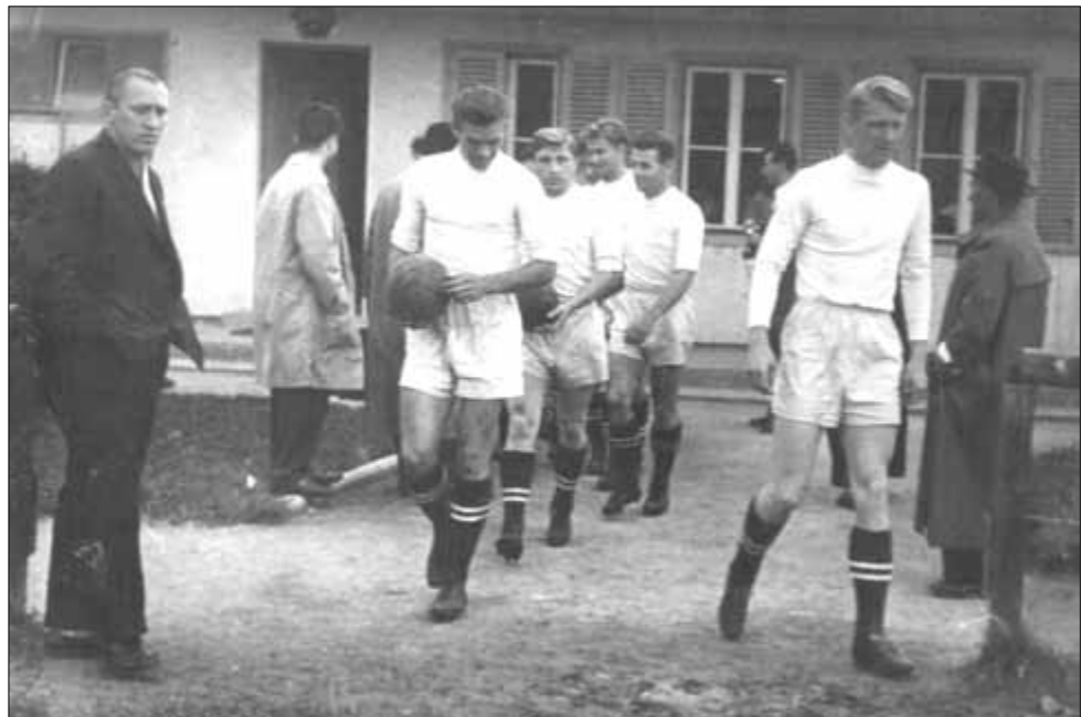
Перед товарищеской встречей в Австрии