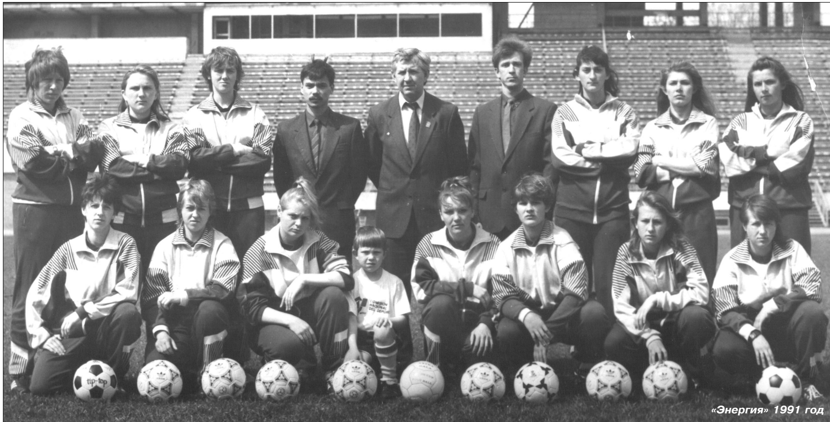
«Энергия» 1991 год

- Положительной. Кто-то пришел на стадион ради экзотики, но всем понравилось. Не зря в России Воронеж одно время был первым по посещаемости. Только потом нас обошла Рязань. Отлично помню, как в 1991 году на кубковый финал в Подмоскowie мы решили организовать «чартерный» плацкартный вагон. Так желающих набралось столько, что не осталось ни одного свободного места. Болельщики приехали с гармошками, концерт делегировал ансамбль. Такой поддержки в женском футболе не было ни у одного клуба в России.